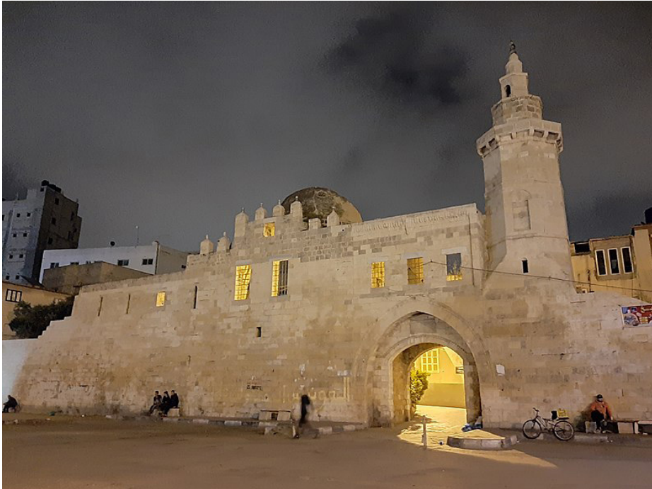
Il castello di Barquq distrutto dalle forze di occupazione israeliane il 23 aprile 2024, foto di Ahmed Hasi Alagha, Wikimedia Commons

menti e Siti (ICMOS) del 9 gennaio 2024 che ne denuncia la pressoché totale distruzione. 80 Perfino il castello Barquq (1387) –per citare forse il monumento storico più pregevole di Khan Yunis–, ancora in piedi fino a poco tempo fa, è stato raso al suolo. Si tratta della perdita di un pezzo importante del patrimonio storico mondiale che non riguarda solo i/le palestinesi di Gaza, ma l’umanità tutta.