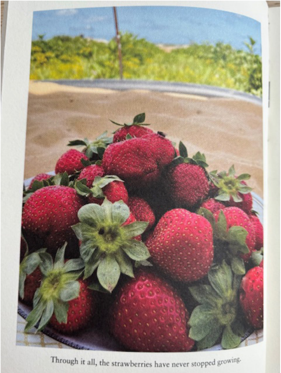
Through it all, the strawberries have never stopped growing.